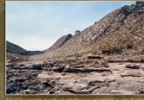
10. Conglomerats de l'era de Caltorra que es troben a la zona de Caltorra (Caltorra).