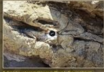
8. Canals estratigràfics de l'era de Caltorra (Caltorra).