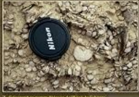
7. Columnes hermètiques de l'era de Caltorra.