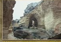
15. Escultes (Tribal superior) de l'era de Caltorra i prop de la zona de Sant Joan, al llarg de la zona prop de la Cala de Muro.