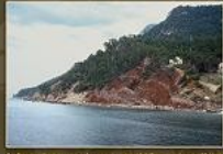
2. Drenatges verticals i conglomerats roques del Barcassellada (Tribal inferior) al port de S'Alqueria.