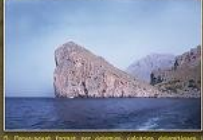
5. Propagades format per calcaris, calcaris, calcaris i calcaris (Tribal superior) de la zona de Sant Joan, al llarg de la zona prop de la Cala de Muro.