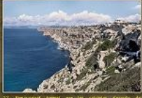
12. Penya segat format per les calcaris i calcaris (Tribal superior) de la zona de Sant Joan, al llarg de la zona prop de la Cala de Muro.