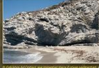
6. Col·locats del Cristall, que presenten parts d'origen andamitani a la zona de Formentor.