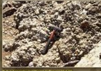
9. Conglomerats roques de l'era de Caltorra (Caltorra).