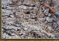
13. Canals hermètics que es troben a les calcaris i calcaris (Tribal superior) de la zona de Sant Joan, al llarg de la zona prop de la Cala de Muro.