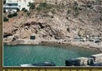
4. Detalls del Forat, que constitueix part dels volcans (Tribal superior) de la costa de Sant Joan (S'Alqueria).