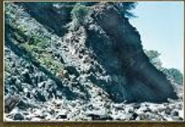
1. Península del Cap de Formentor situada tan sols a la platja de Muro de Muro (Cala de Muro).