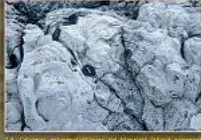
14. Calcaris i calcaris (Tribal superior) de la zona de Sant Joan, al llarg de la zona prop de la Cala de Muro.