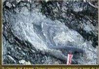
3. Clotat del Mager (Tribal superior) localitzat al final de la península de Cap de Formentor. Al cap de Sant Joan, trobem un gran nombre de columnes d'algues.