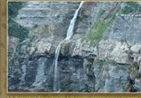
11. Propagades format per calcaris i calcaris (Tribal superior) de la zona de Sant Joan, al llarg de la zona prop de la Cala de Muro.